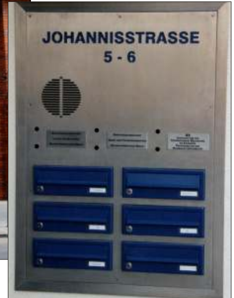
Briefkastenanlage - Edelstahl