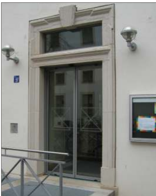
Automatische Raumspar - Türanlage, feingerahmt