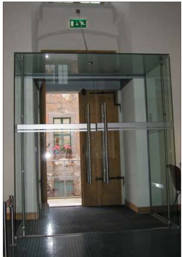
Punktgehaltene Ganzglas - Windfanganlage - Mensa Beschlüge: Fa. Dorma Manet als Sonderanfertigung Glasstatik mit Zustimmung im Einzelfall