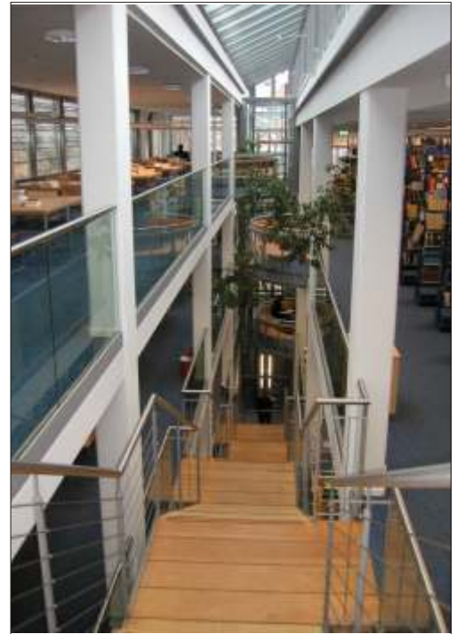
Stahlwagentreppe mit 5 wechselseitigen Treppenpodesten