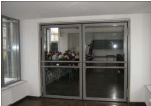
Pendeltür zum Hörsaal Jansen Economy