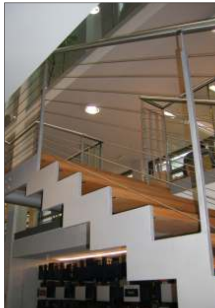
Geländer mit Edelstahlseilfüllung

Bauherr: Franckesche Stiftungen Halle/S.