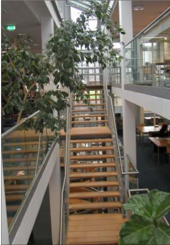
Brüstungsverglasung einseitig eingespannt mit eingesetztem Edelstahlhandlauf