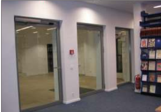
Feuerschutztür T 30 - 1, Fa. Jansen Janisol 2 F 90 Stahl - Glas - Element, Fa. Schüco II mit Zustimmung im Einzelfall