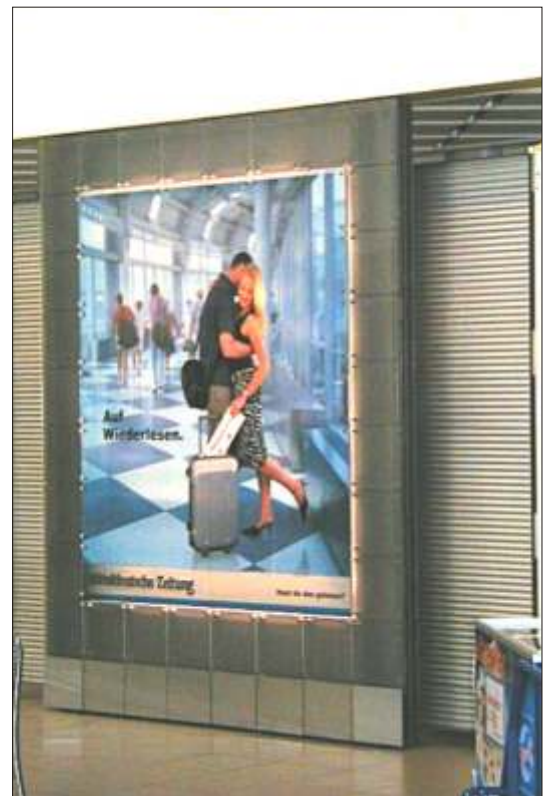
Werbeträger “Mitteldeutsche Zeitung” B: 2396 mm x H: 2960 mm x T: 128 mm Diakasten hinterleuchtet B: 1804 mm x H 2104 mm