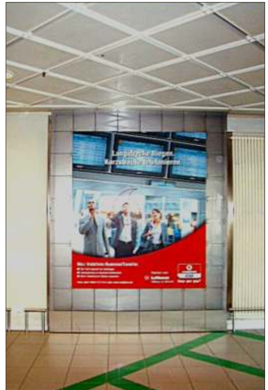
Werbeträger “Vodafone” - wandhängend