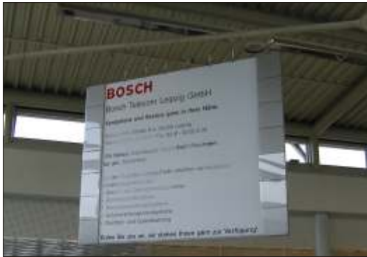
Werbeträger “Bosch Telecom” hängend

BEHNISCH ■ HERMUS ■ SCHINKO ■ SCHUMANN Architekten / Diplomingenieure Leipzig